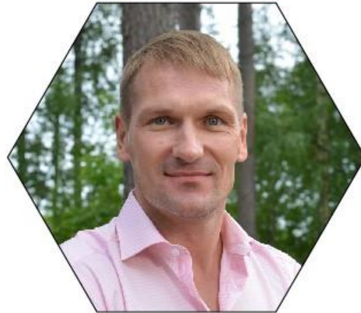
RAIN VÄÄNA RAGN-SELLS AS