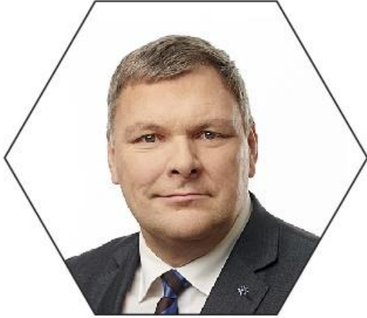
MARKO POMERANTS ISAMAA