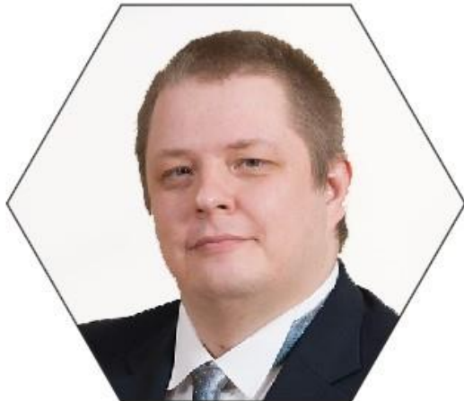
ERKI SAVISAAR KESKERAKOND