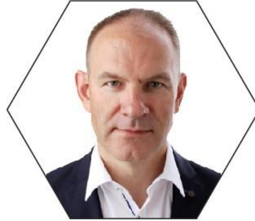
ARGO LUUDE EKRE